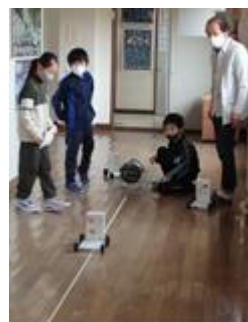
3年生「風やゴムで動かそう」

また、3年生以上の外国語活動と外国語の授業では、ALTの先生が入って、ネイティブの発音に触れながら、楽しく学習しています。