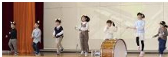
1・2年「MUSIC SHIMAKAWA スーパーライブ2022」

10月22日（土）に学習発表会を実施しました。子供たちは練習の成果を発揮し、堂々と発表する姿を見せていました。