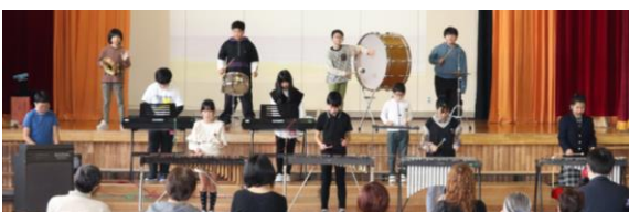
5・6年「創造世界へ～Society5.0から 見える北斗の未来～」