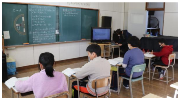
～5年生の少人数指導の様子から～

子供にとって少しでも「わかる」「できる」という達成感を味わうとともに、意欲的に学習することができるように進めています。