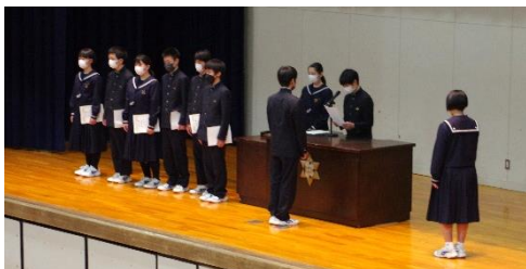
前期認証式の様子